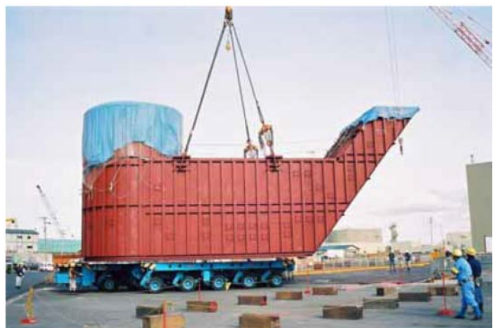
図 2.1.7 原子炉下部キャビティ室構造体

RWS T (Refueling Water Storage Tank) については、「用語・略語リスト（以下リンク）」に以下の説明がある。