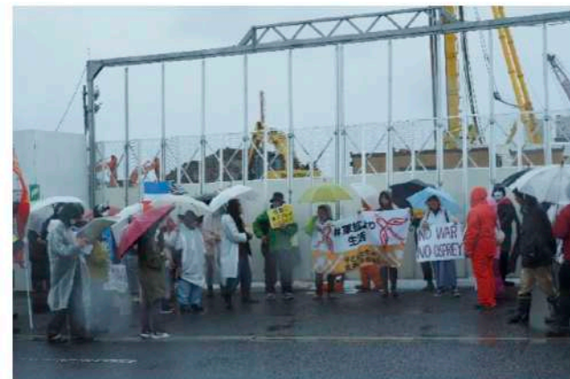
オスプレイ配備に抗議する市民グループ=12日午後、佐賀空港西側

佐賀空港(佐賀市川副町)への自衛隊輸送機オスプレイ配備に反対する市民グループは12日、空港西側の駐屯地工事を止めるための抗議行動を実施した。強い雨風の中、県内外から参加した約40人が工事現場の入り口でマイクを握り、反対の意思を示した。